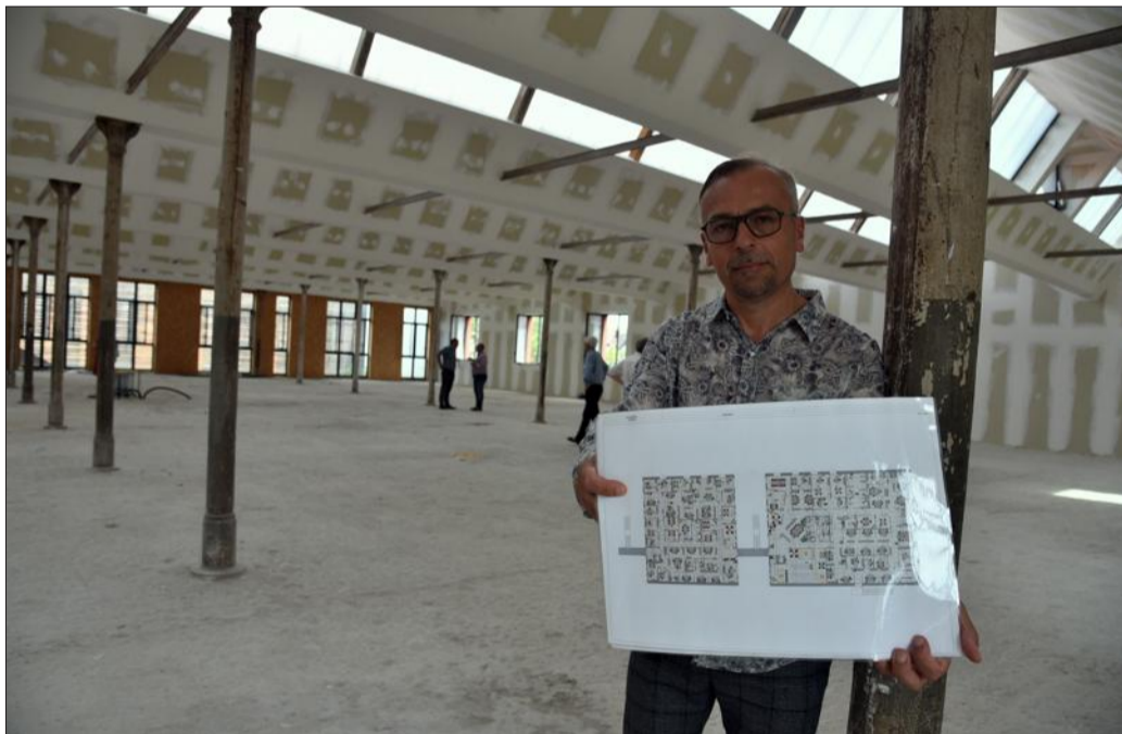
Lorsque l'association Appuis sera installée sur son plateau de 1800 m 2, c'est elle qui occupera la plus grande surface du bâtiment 33 de DMC, qui compte 16 locataires.